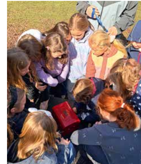
Achtung knifflig: Bei Oster-Olympiade des Offenen Kindertreffs galt es Aufgaben zu lösen.

Bis zu einem Jahr bleiben Familien in der Einrichtung. Regelmäßig finden Gespräche mit den zuständigen Mitarbeiterinnen des Jugendamtes statt. Gemeinsam wird entschieden, wie es anschließend