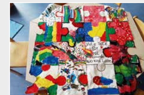
Kita Bachstraße in Lotte (u.), Kita Spinnereistraße in Gronau (o. l.) sowie die OGS Comeniuschule in Herten (o. r.) und Hinsberg in Recklinghausen.