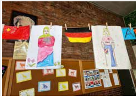
In der OGS Wilhelmschule Weusters Weg in Gladbeck schmückt eine Menschenbilderkette die Räumlichkeiten. Sie soll die Diversität innerhalb der Gesellschaft sichtbar machen und steht für Zusammenhalt und Gleichwertigkeit.