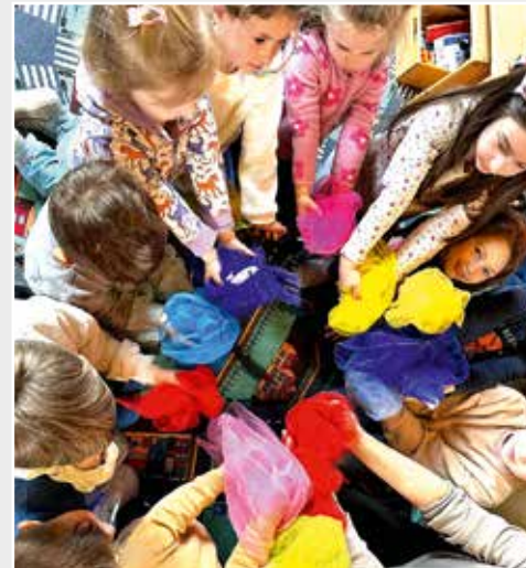
„Herz statt Hetze“ hieß es in der Kita Schützenstraße in Borghorst.