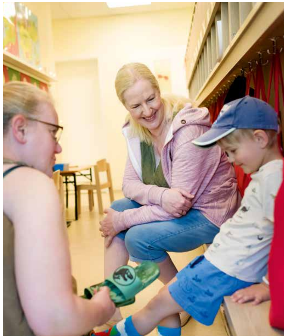
Die Gespräche zwischen Fachkräften und Eltern während des Abholens sind für alle wichtig.

„Die Finanzierung bleibt unrealistisch. Das erschwert die Personalplanung, die Weiterqualifizierung, die Ausstattung der Räume, die Instandhaltung der Einrichtungen zusätzlich. (...) Sprachförderung und Inklusion sind unterfinanziert, obwohl die Anforderungen steigen.“