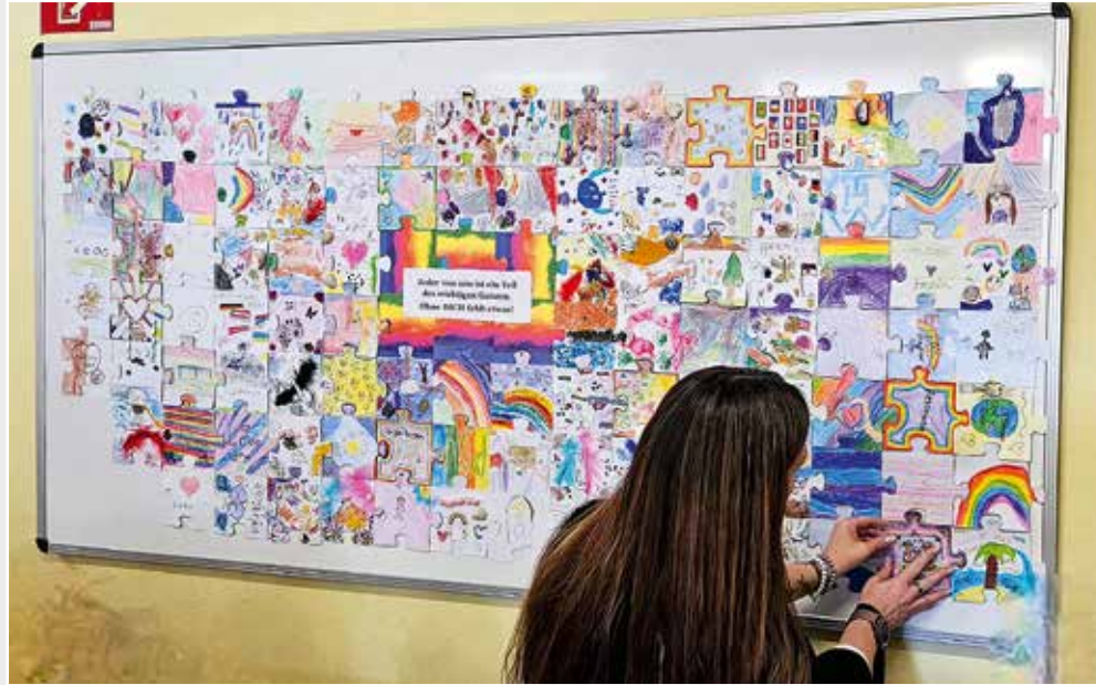
An der OGS Kohlkampfschule haben die Kinder ein riesiges Puzzle gestaltet. Die Botschaft: „Jedes Kind ist ein Teil unserer Gemeinschaft und ein wichtiger Bestandteil.“