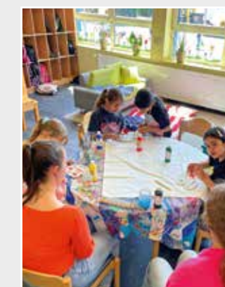
Malen für Vielfalt in der OGS Josefschule Ahaus.