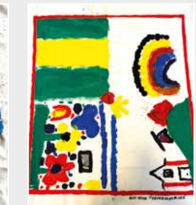
Kita Plackenstraße Rheine