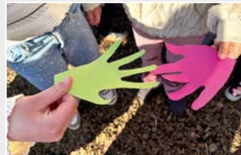
„Ich gebe Dir meine Hand, du gibst mir Deine Hand.“ So lautete das Motto an der Waldschule.