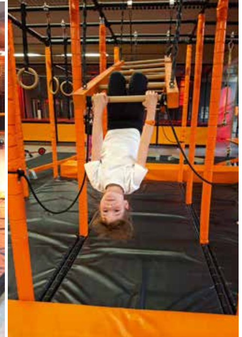
Im Ninja-Parcours konnten sich die Kinder richtig austoben.