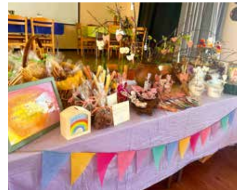
Beim Frühlingflohmarkt wurden viele kreative Dekorationsideen verkauft.