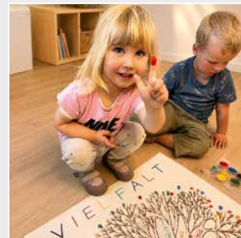
Kreativ im Familienzentrum Zum tiefen Reck in Lotte.