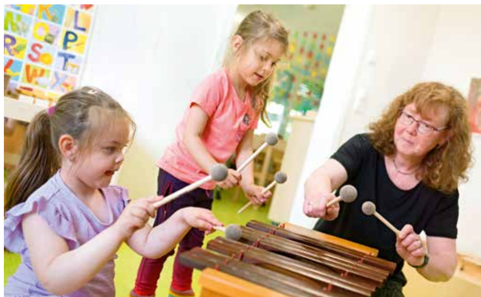
Gemeinsames Musizieren stärkt Kreativität, Ausdruck und das Miteinander.