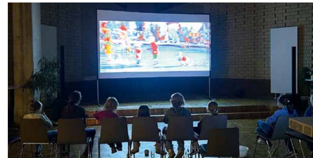
Regelmäßig findet in der Kreuzkirche ein Kinoabend für Kinder statt.

weitergeht. Der „freie“ Mittwoch wird von den Mitarbeiter*innen genutzt, um Hausbesuche durchzuführen, Beobachtungen und Gespräche in Kitas wahrzunehmen oder die Familien beim Aufbau eines tragfähigen sozialen Netzwerks zu unterstützen. Dabei geht es nicht nur um die Förderung der Kinder. Auch die Eltern benötigen Entlastung und verlässliche Bezugspersonen in ihrem Umfeld. Gemeinsam mit den Familien arbeiten die Fachkräfte daran, Kontakte zu knüpfen und Hilfen zu erschließen, die auch über die Zeit in der Tagesgruppe hinaus Bestand haben. „Wir wollen, dass die Eltern hier ein tragfähiges