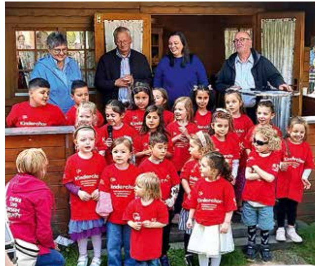
Der Kinderchor begeisterte mit seinem Auftritt alle Besucher*innen.