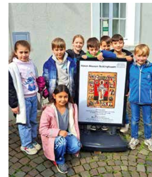
Die gelbe Gruppe erkundete das Ikonenmuseum in Recklinghausen.