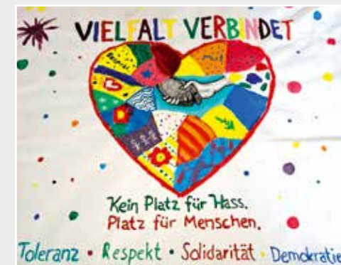
Ambulant Betreutes Wohnen für Menschen mit kognitiver Beeinträchtigung