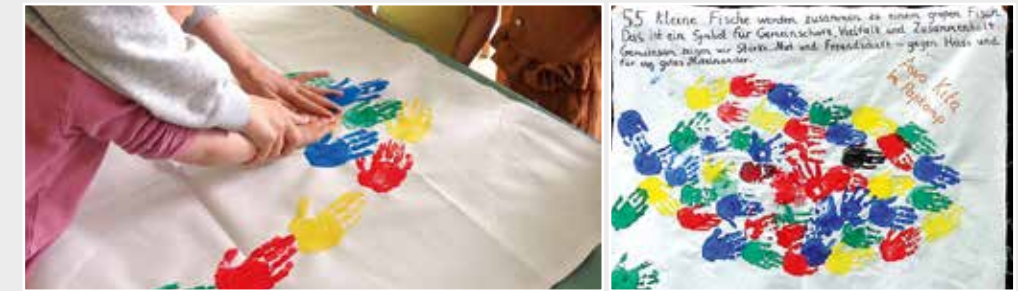
Das Banner der Kita im Paßkamp Recklinghausen.