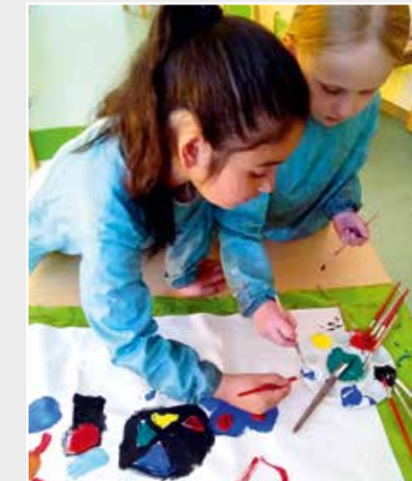
Kita Spinnereistraße Gronau