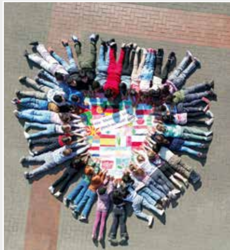
Die OGS-Kinder der Josefschule in Ahaus haben die Flaggen der Herkunftsländer ihrer Eltern und Großeltern gemalt. Daraus wurde ein Herz geklebt und anschließend fotografiert.