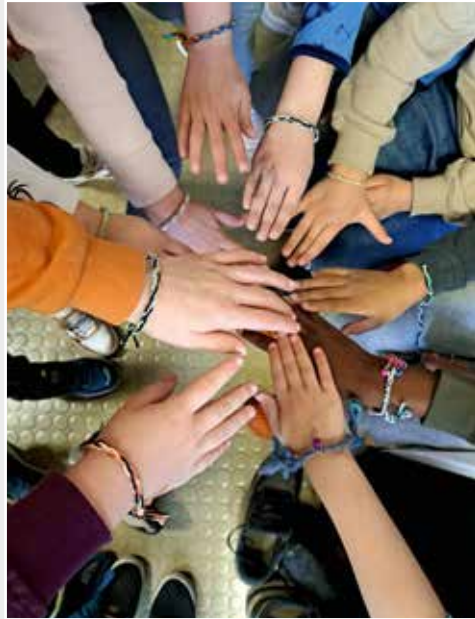
Unter dem Motto: „Freundschaft über alle Grenzen“ hat jedes der 100 Kinder in der OGS der Albert-Schweitzer-Schule Dorsten ein Freundschaftsarmband geknüpft. Anschließend durfte dann jedes Kind ein Armband aus einem Beutel ziehen.