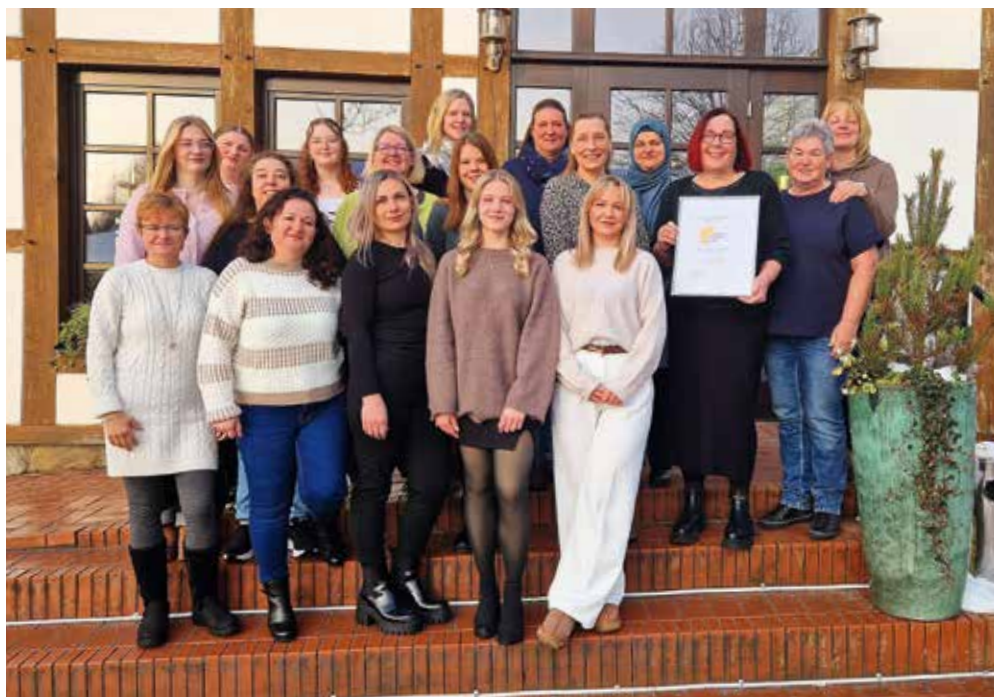
Das Kita-Team freut sich über die Rezertifizierung ihrer Einrichtung.