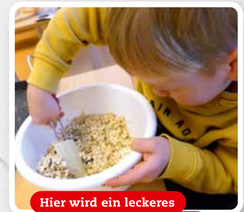
Hier wird ein leckeres Knuspermüsli angerührt.

Die Kita Lohausstraße macht mit bei AOK Jolinchen-Kids!