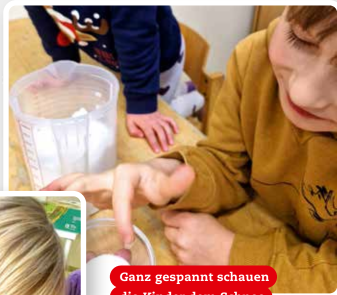
Ganz gespannt schauen die Kinder dem Schnee beim Schmelzen zu.

Bei uns in Mettingen wurde es richtig kalt, aber auch super bunt! Wir haben tolle Experimente mit Wasser, Farben, Eis und Schnee gemacht.