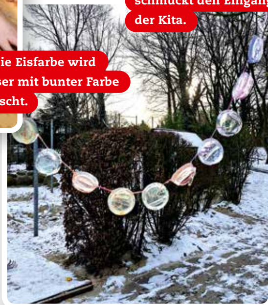
Die Eisgirlande schmückt den Eingang der Kita.

Wir haben Wasser mit Farbe gemischt, Stiele hineingesteckt und alles eingefroren. Leider hat das Malen mit den Eisfarben nicht so gut geklappt. Aber das ist nicht schlimm, denn beim Experimentieren darf auch mal etwas schiefgehen.