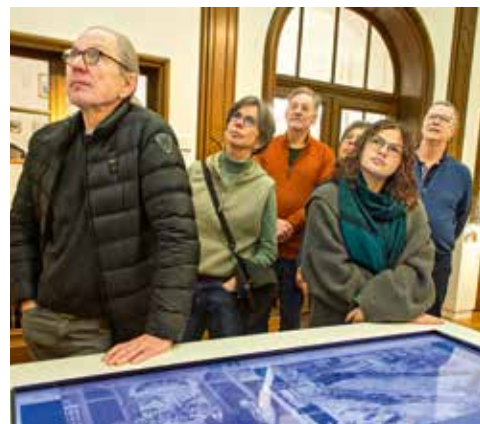
Multimedial ist die Ausstellung in der Villa ten Hompel aufgebaut.

Die Wirkung ist spürbar. Die AWO ist präsent im öffentlichen Raum und wird als interessant, als ansprechbar wahrgenommen. Die Rundgänge sind kommunikativ, vermitteln Kontakte, schaffen Verbindungen – über Geschichte, über Politik, über das eigene Leben in dieser Stadt. Als die Gruppe an diesem Nachmittag die Villa ten Hompel verlässt, ist es bereits dämmerig. Einige bleiben noch stehen, tauschen