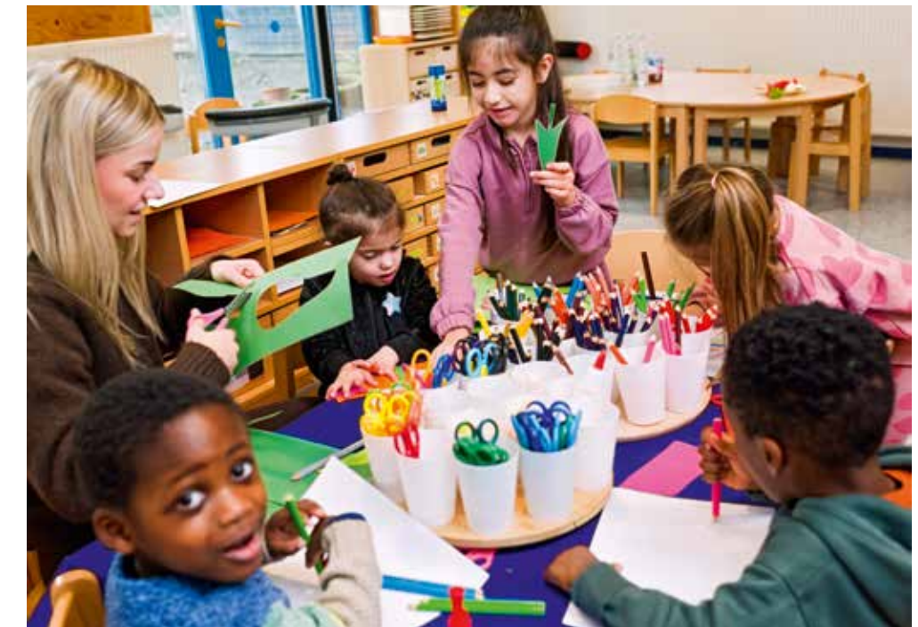
Die Mitarbeiterinnen im Familienzentrum Merkurstraße in Marl-Mitte arbeiten täglich daran, allen Kindern die gleichen Startchancen zu ermöglichen.

Deshalb bekommen die Kinder in der Kita dort mehr Hilfe als woanders.