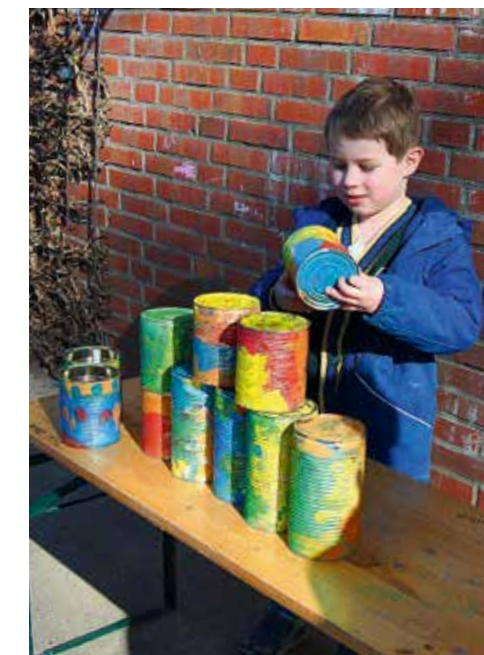
Schubkarren-Parcours und Dosenwerfen waren zwei von vielen Spielstationen.