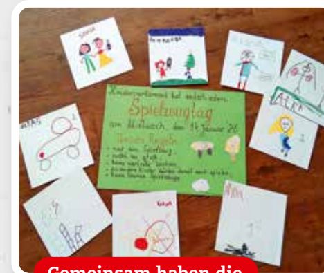
Gemeinsam haben die Kinder Regeln für den Spielzeugtag aufgestellt.

In unserer Kita ist ein Spielzeugtag etwas ganz Besonderes. Normalerweise bleiben die Spielsachen von zu Hause nämlich daheim. Manchmal gehen Sachen kaputt oder verloren – und dann gibt es schnell Streit. Aber in letzter Zeit haben viele Kinder begeistert von ihren Lieblingsspielsachen erzählt. Das klang so spannend, dass einige Kinder gefragt haben: „Dürfen wir nicht einmal unsere Spielsachen mitbrin-