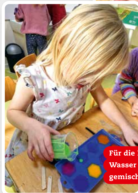
Für die Eisfarbe wird Wasser mit bunter Farbe gemischt.